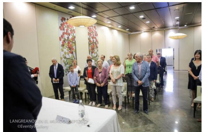
Entrega de premios 2022