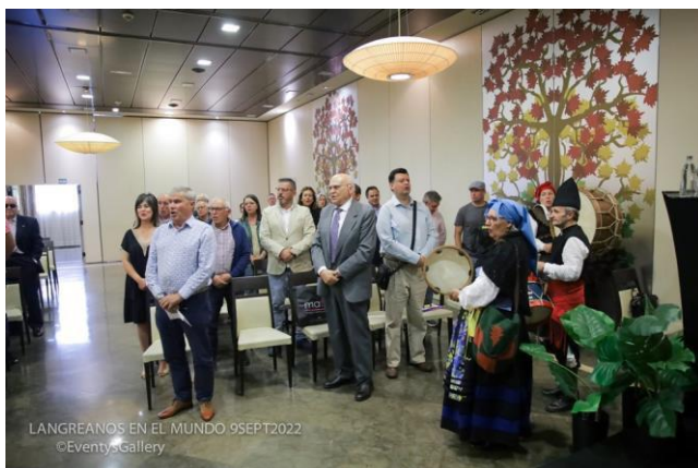
Entrega de premios 2022