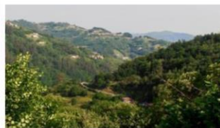
Valle de Samuño candidato "pueblo Ejemplar"