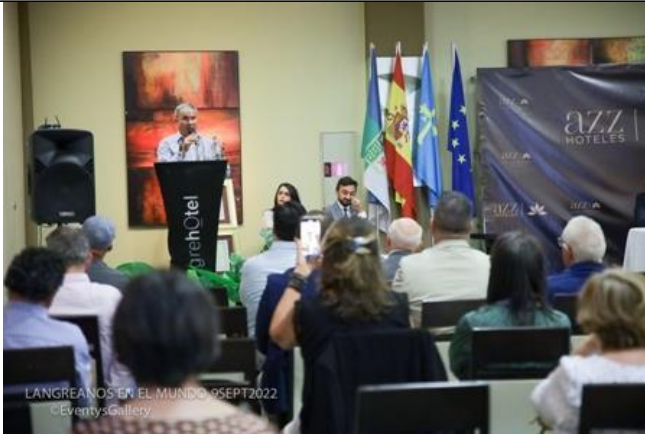
Entrega de premios 2022

En este apartado iremos incluyendo de forma aleatoria fotos de la historia de la Asociación. La mayoría de ellas se pueden ver también en nuestra WEB en el apartado de FLICKR, en el siguiente enlace: https://www.flickr.com/photos/44322988@N06/sets/C