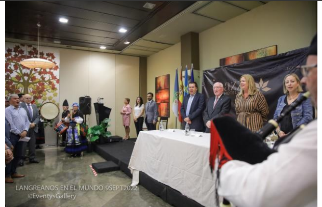
Entrega de premios 2022