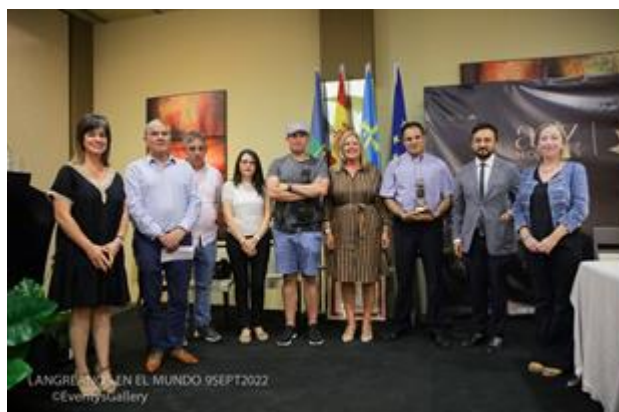
Entrega de premios 2022