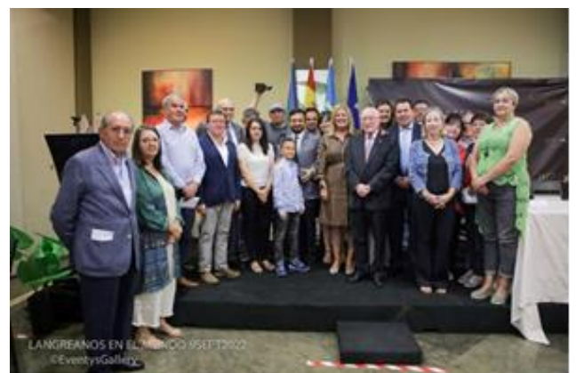
Entrega de premios 2022